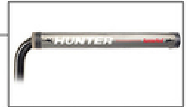
Оptionальный лазерный указатель HammerHead®