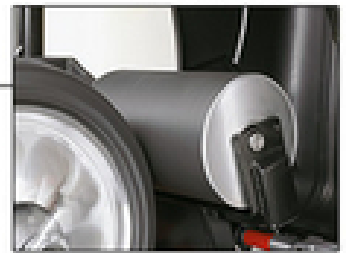
Нагруженный диск RoadForceTouch®